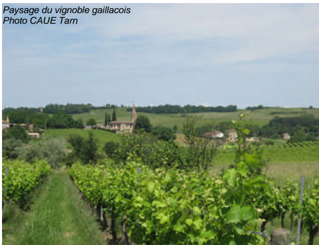
Paysage du vignoble gaillacois

- Valeurs spatiales et héritées des espaces agricoles : présentation du SCOT du pays Vignoble Gaillacois, Bastides et Val Dadou et lien avec le projet d'itinéraire culturel européen du vin et du vignoble.