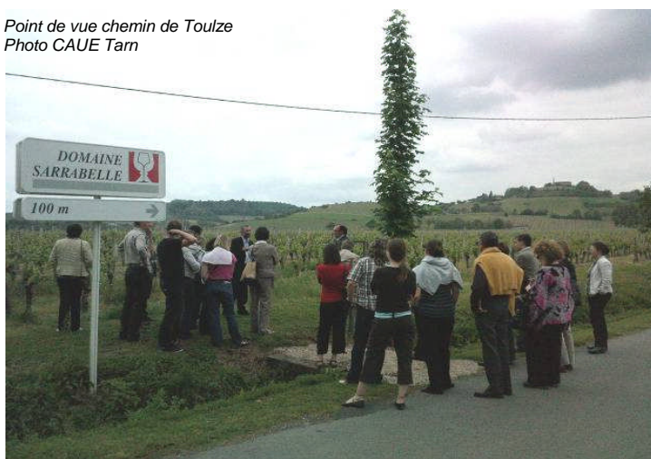
Point de vue chemin de Toulze