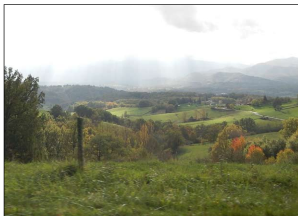
Paysage du Volvestre