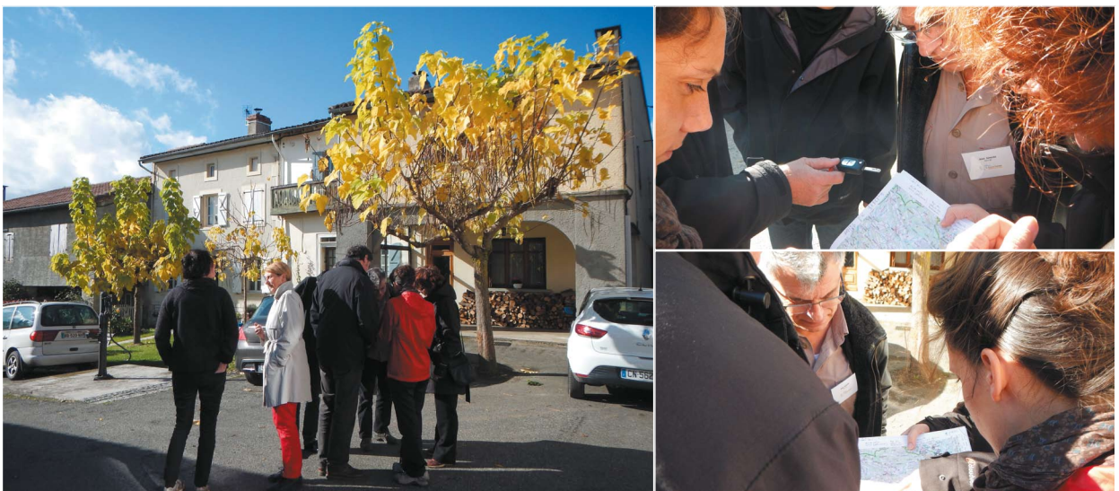
Journée thématique d'échanges du 14 novembre 2013 : exercice de terrain

paysages. Puis celui, qui se reflète à travers le dialogue et l'échange qui met en tension positive la personne et les autres pour lequel il s'agit pour partager, d'explicitier et de convaincre. Dès lors, dans ce kaléidoscope, on compose avec les différences, on précise le commun à partir des différents points de vues et de regards.