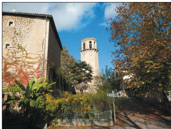
Paysage du Volvestre