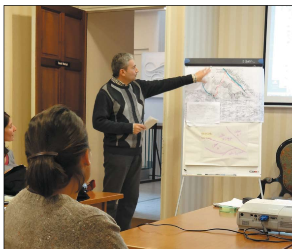
Journée thématique d'échanges du 14 novembre 2013 : restitution en salle

Cette parole donnée aux habitants de l'Arize n'attend qu'à se prolonger par un meilleur accord à l'atlas des paysages et à une traduction dans les futurs documents d'urbanisme comme autant de repères et d'enjeux pour un patrimoine vivant, support de qualité de vie.