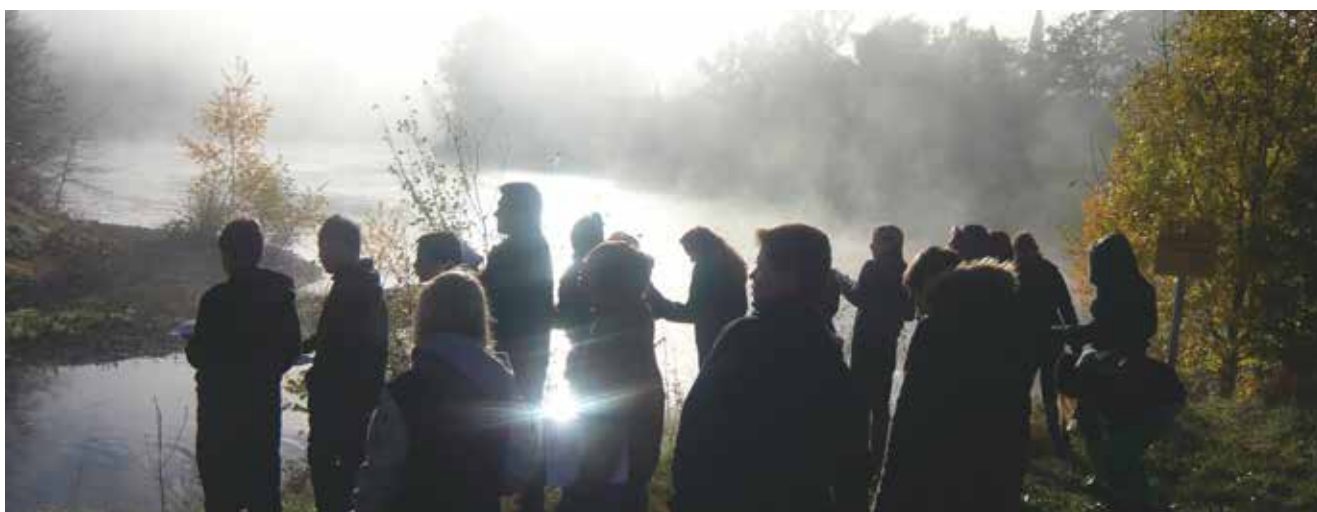
▲ Animation à la confluence de l'Arize et de la Garonne dans le cadre des ateliers « Portraits de Paysages »

Par sa réflexion collective, le réseau Paysage Midi-Pyrénées a démontré une capacité de faire assez exemplaire qui devra profiter à la future grande région.