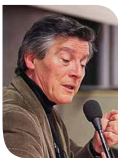
Pierre Donadieu, agronome, écologue et géographe, professeur émérite à l'École nationale supérieure du Paysage de Versailles.