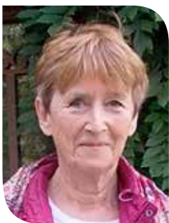
Odile Marcel, philosophe et écrivain, Professeur honoraire à la faculté de Lyon III

Pour Odile Marcel, la connaissance des paysages est une connaissance sensible et inventive, qui implique une compétence d'artiste, de peintre et d'écrivain. La description est aussi un récit, qui embrasse la dimension du retentissement, de l'appropriation par le sujet social. Connaître le paysage est tellement d'ordre culturel que le regard porté sur le paysage ne cesse de se réinventer