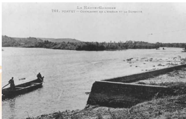
Illustration extraite de l'observatoire Garonne ▶

connaissance pour permettre la compréhension du territoire et en suivre l'évolution, notamment à partir de cartes postales anciennes et d'un travail de photo-comparaison. Les acteurs locaux et habitants ont été impliqués pour recenser les données anciennes, recueillir des témoignages sur leurs perceptions des paysages et participer aux reconductions photographiques.