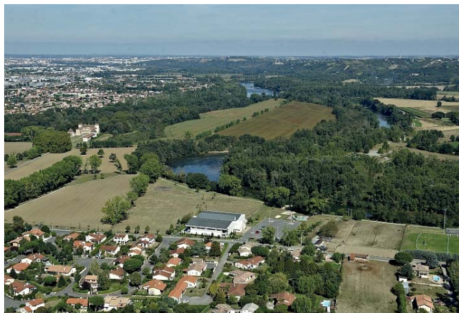
Vue aérienne de la confluence Ariège-Garonne

Territoire exposé au risque inondation, protégé au titre des sites et des monuments historiques, réserve naturelle régionale, autant de protections qui régissent l'occupation des sols et la vie des populations, peut-être l'une des raisons pour laquelle le village s'est détourné de sa confluence au XX e siècle.