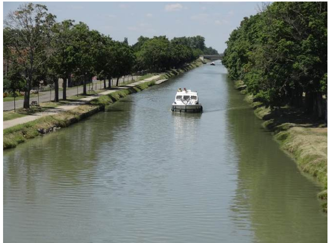
Le canal de Garonne à Grisolles, présentation de la liaison entre la gare et le bourg et navigation sur le canal