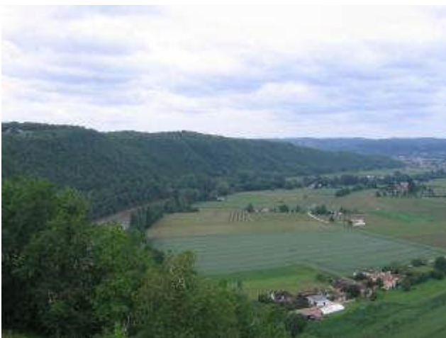
Arrêt n°1 : Découverte de la boucle de Prayssac depuis le belvédère de Belaye.

Support : Le dossier « Paysages du vignoble du Cahors, repères » remis aux participants par le CAUE du Lot est disponible sur l'Extranet du Réseau Paysage Midi-Pyrénées