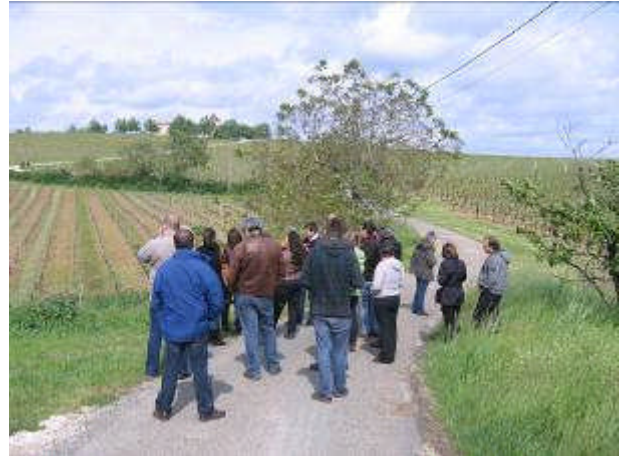
Arrêt n°3 : Points hauts boisés et dépressions viticoles marquent le paysage du plateau de Cournou (Saint Vincent Rives d'Olt).