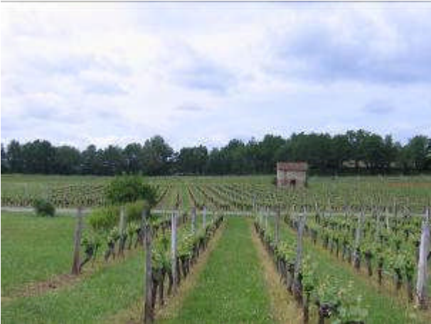
Arrêt n°2 : Un semis de cabanes de vigne parfois accompagnées d'un noyer, « habite » et ponctue le vignoble de l'île à Luzech