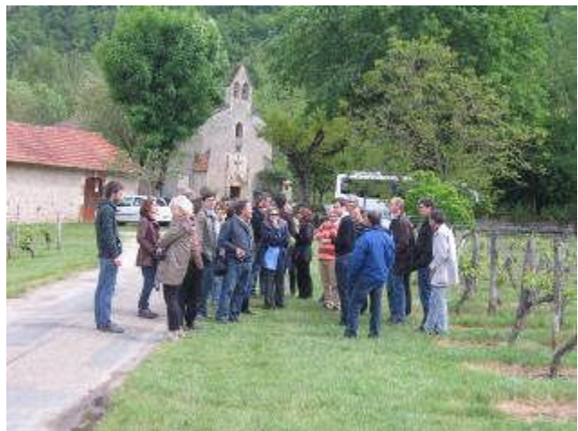
Arrêt n°2 : Notre dame de l'île dans la boucle de Luzech.