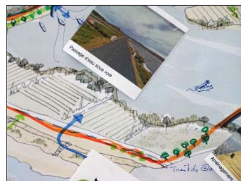
Travail en atelier sur la TVB