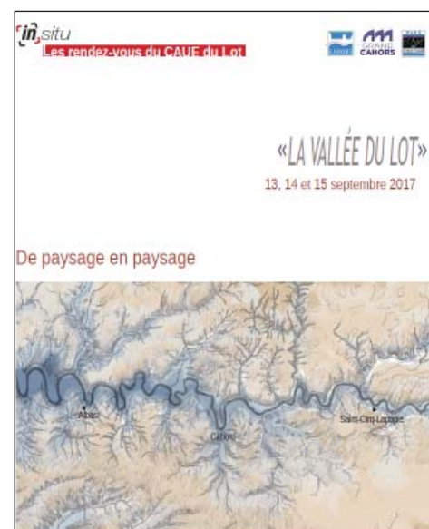
De paysage en paysage

http://www.caue-mp.fr/46-lot-actus/in-situ-la-vallee-du-lot/itemid-164.html