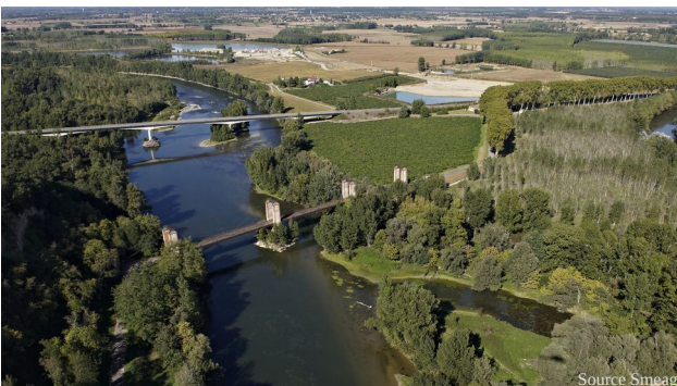
La Garonne à l'aval de Bourret (Tarn-et-Garonne)

L'emboîtement des échelles est aussi un prérequis de la prospective, que Denis Lacroix de l'Ifremer a présenté. Le changement climatique impose à la fois d'avoir une vision stratégique mondiale et de réfléchir localement aux solutions réalistes et adaptées localement. Le maire se trouve alors au centre d'un système d'acteurs multiple et complexe où chacun a son horizon temporel et son échelle géographique d'intervention, ceci nécessitant de raisonner à la fois dans l'espace et dans le temps.