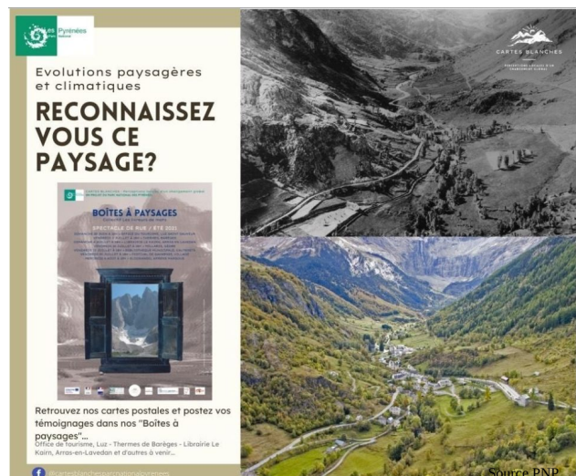
Opération Carte Blanche du Parc National des Pyrénées

Éloïse Deutsch, du Parc National des Pyrénées, constatant la difficulté de passer à l'action et de toucher des populations pas encore convaincues à la nécessité d'agir face au changement climatique, a présenté le choix d'une entrée par le paysage dans le projet « Carte blanche, changements paysagers et climatiques ». Sur la base de visuels mettant en rapport carte postale ancienne et photographie récente, environ 150 personnes se sont exprimées et ont ainsi alimenté une étude ethnologique sur la perception du changement climatique.