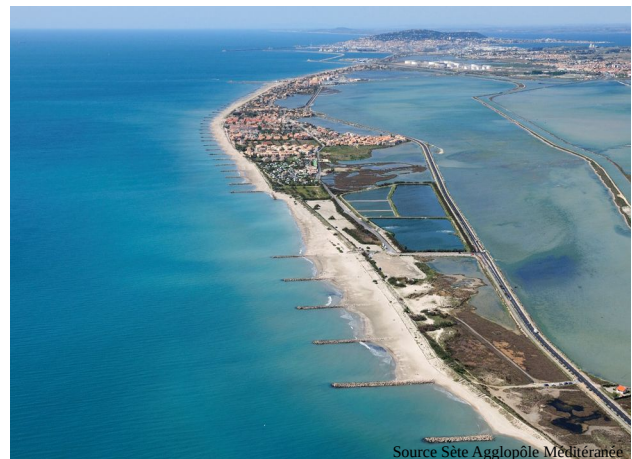
Le littoral, vue aérienne vers Sète et l'étang de Thau

rédigé une charte pour la Garonne et ses confluences. Son but est d'impliquer tous les acteurs (collectivités, agriculteurs, EDF, ...) qui interviennent sur le fleuve et d'insuffler une dynamique commune, en vue de la restauration de ses milieux, mais aussi de son identité territoriale. Côté massif pyrénéen, le comité de massif réunit les acteurs très divers (élus, parlementaires, professionnels, associations de protection de l'environnement) et élabore le schéma de massif. Ce document cadre détermine les grandes orientations partagées pour une montagne qui soit à la fois vivante et résiliente dans le contexte du changement climatique. Les orientations partagées à l'échelle de ces grands ensembles paysagers ont vocation ensuite à être déclinées par chacun des acteurs, sur chaque territoire et pour chacun des projets.