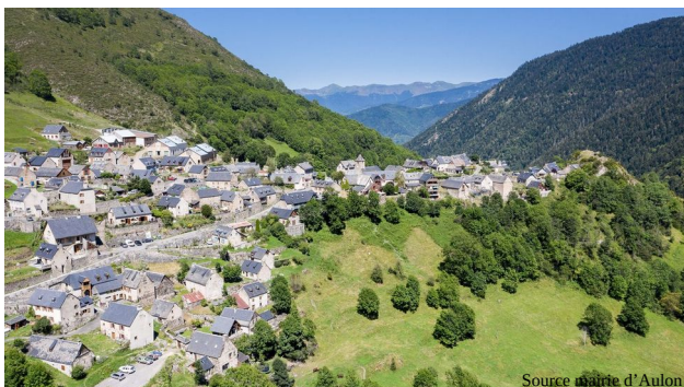
Le village de Aulon (Hautes-Pyrénées)