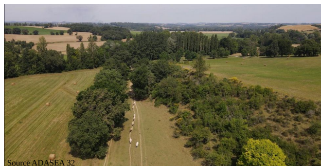
Bocages et prairies du Gers

Hélène Rey-Valette énonce ainsi que les recherches menées montrent une évolution sociétale où le rôle des espaces naturels est reconnu pour la santé et le bien-être, et qu'ils deviennent un élément primordial du cadre de vie, une invitation à imaginer une nouvelle manière de concevoir les projets en priorisant les solutions fondées sur la nature.