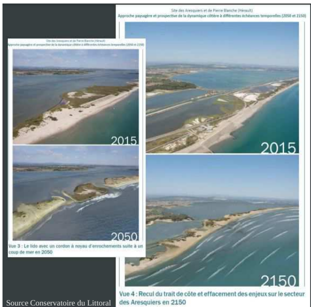
Simulation du recul du trait de côté (Hérault)

À l'échelle du grand paysage, toujours, Catherine Farelle a poursuivi sur la variation des rivages de la mer méditerranée. Les phénomènes actuels dessinent finalement un ancien rivage dans une très grande profondeur historique, avant le dépôt sédimentaire de l'ère tertiaire. Se replonger ainsi dans le temps passé, invite à considérer ces processus d'évolution du trait de côte comme des processus vivants et évolutifs, qu'il faut intégrer pour mieux envisager l'avenir. Comprendre les paysages, leurs structures, leurs spécificités et leurs trajectoires va alors permettre à la fois de considérer le territoire comme un déterminant pour des projets résilients et adaptés aux capacités du milieu, mais aussi de se projeter et d'identifier des scénarii qui vont rendre les projections climatiques tangibles. Ces projections fondées sur une analyse approfondie sont nécessaires pour anticiper et prendre les décisions qui permettront de ne pas subir, mais de s'adapter, résume Denis Lacroix de l'Ifremer.