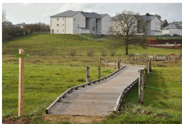
Notre Seigne, Onet-le-château (Aveyron)

« Et n'oublions pas le B-A-BA de la méthode paysagère qui fait que c'est l'affaire de tous. Les usagers [agriculteurs et non agriculteurs, les usagers de l'eau et usagers de la nature ou représentant finalement des milieux non humains] doivent se rassembler pour trouver une solution adaptée aux singularités géographiques. » JP Thibault