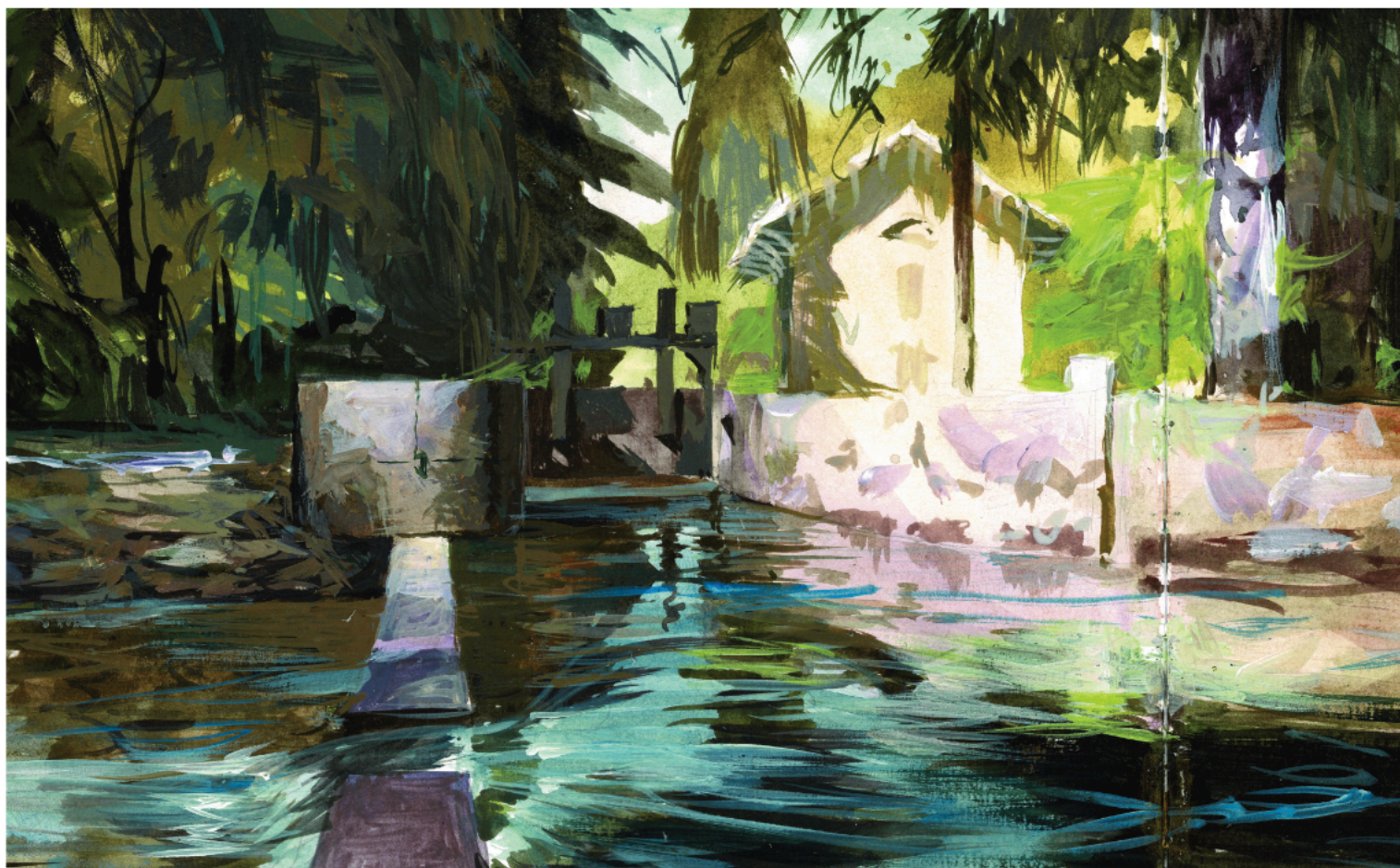
Illustration © Christophe Pons-Capitaine

02 - 31 mai Espace Reynès / Albi entrée libre lundi 14h/18h - mardi au samedi, 9h30/13h - 14h/18h sauf fériés